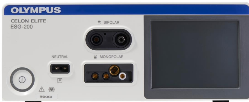
Figura 1. Vista anteriore del dispositivo

OLYMPUS ITALIA S.R.L. - Società unipersonale