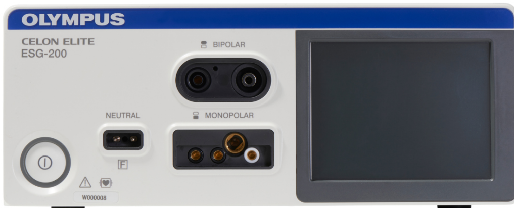
Figura 1. Vista anteriore del dispositivo