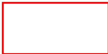
Figura 2. Etichetta del dispositivo sul retro