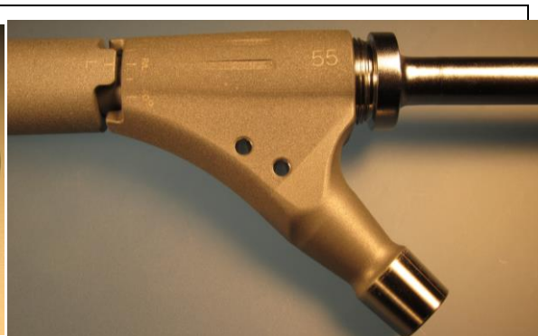
Foto 2: collegamento parziale tra lo stelo prossimale Revitan e l'impattatore modulare Revitan RIF 01.00409.800.