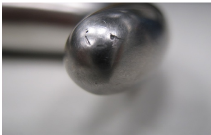
Figura 1: Divaricatore per nervo sciatico come descritto sopra

Durante il processo di fabbricazione potrebbero essersi formati alcuni micropori sulla impugnatura cava del divaricatore per nervo sciatico. I micropori sono abbastanza grandi da consentire ai fluidi di entrare e uscire dalla impugnatura cava.