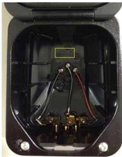
Foto 2: il numero di lotto è riportato all'interno del vano. Il riquadro giallo non è presente nel prodotto. È stato aggiunto nella fotografia per identificare la posizione.

Foto 1: il numero di prodotto scritto in bianco sul lato esterno del coperchio. Il riquadro giallo non è presente nel prodotto. È stato aggiunto nella fotografia per identificare la posizione.