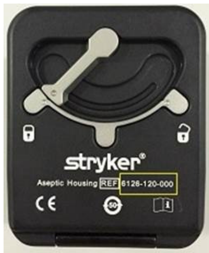
Foto 1: il numero di prodotto scritto in bianco sul lato esterno del coperchio. Il riquadro giallo non è presente nel prodotto. È stato aggiunto nella fotografia per identificare la posizione.

Le foto seguenti indicano dove sono riportati il numero di prodotto e il numero di lotto. Nota: i numeri di lotto 13205, 13209, 13210 e 13212 sono gli unici lotti a essere oggetto di richiamo.