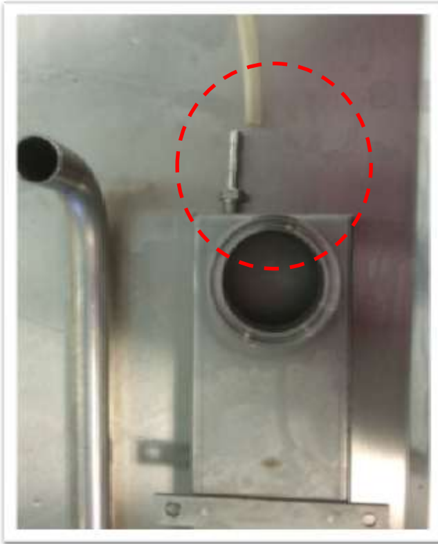
Figura 1: foro di sfiato inserito sulla parte superiore del collettore per evitare intrappolamento di aria.