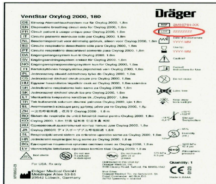
Illustrazione dell'etichetta sulla confezione del tubo monouso 2M86791

Numeri di lotto interessati: 330384.001 - 331661.002