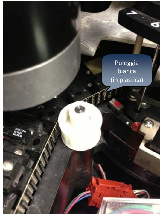
Puleggia bianca (corretta)

Segnate il colore della puleggia nel modulo di risposta allegato, completate il resto del modulo e inviatelo a Beckman Coulter.